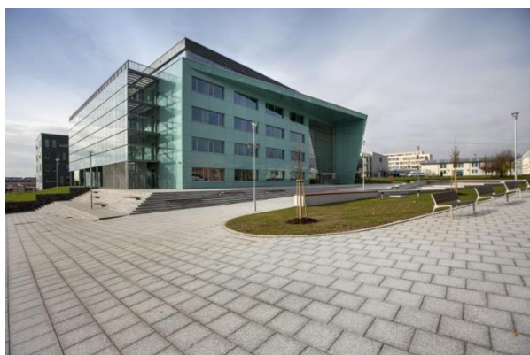
Hlavní vchod do budovy