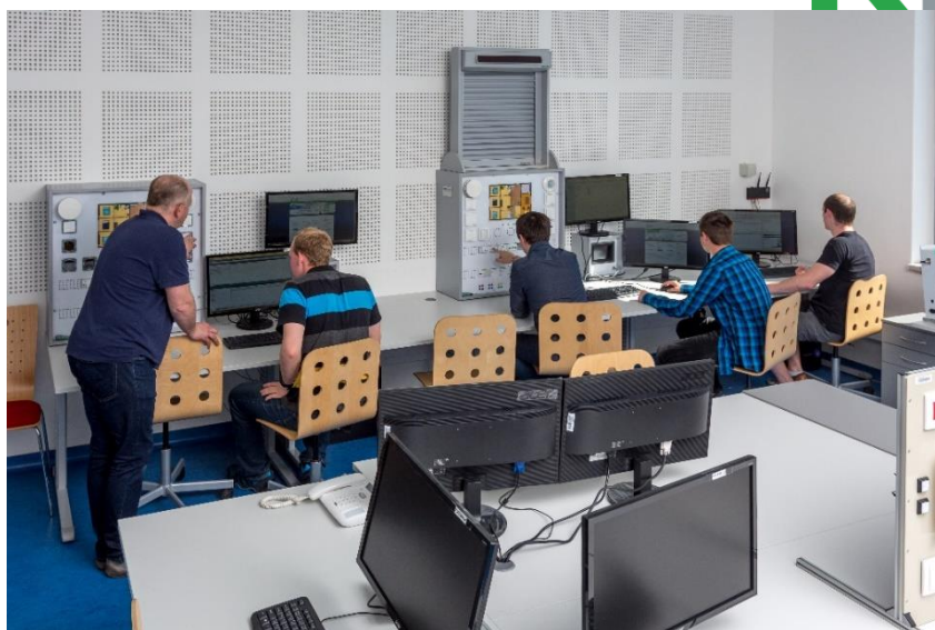
VŠB - TU Ostrava, FEI, kat 450, místnost EB312.